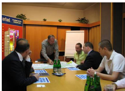
Prezentace projektů firmy Atel Energetika Zlín s.r.o.

Další informace : http://www.agirenet.it ; http://www.energiagijon.es http://zlin.alpiq.cz