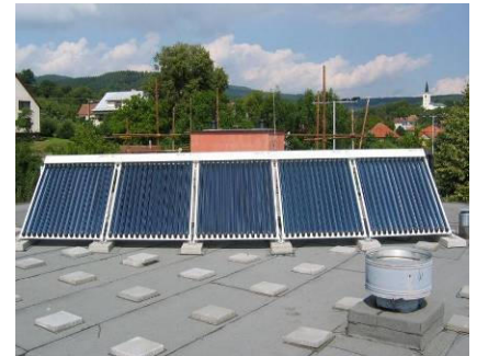
Nový solární systém pro ohřev TV v MŠ Pozlovice

V průběhu srpna a září probíhala v obci Pitín realizace zateplení objektu mateřské školy do pasivního energetického standardu , při které se využilo přírodních materiálů slámy a foukané celulózy . Kromě nového zateplení byla také provedena instalace dřevěných oken s izolačními trojskly, rekuperační jednotky pro větrání kuchyně a solárního systému pro ohřev TV a kondenzačních kotlů. Na konečnou úpravu fasády byla vypsána soutěž a z 24 doručených návrhů byl vybrán návrh představující dětské motivy s tematikou čtyř ročních období. Celkové náklady na rekonstrukci mateřské školy dosáhly 4,4 mil. Kč, přičemž 90 % této částky bude spolufinancováno z OPPS SR-ČR.