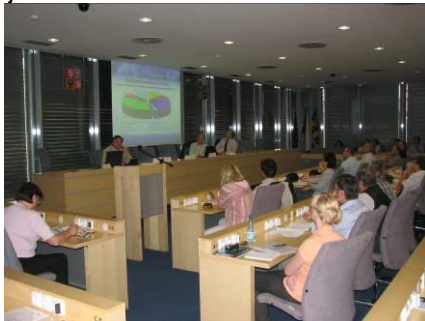
Prezentace OPŽP cílové skupině zájemců