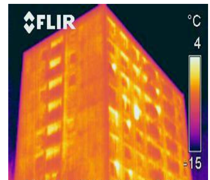
Úniky tepla v nezatepleném panelovém domě