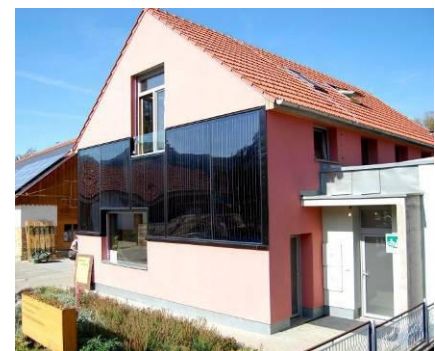
Fasádní solární kolektor pro ohřev TV v Hostětíně