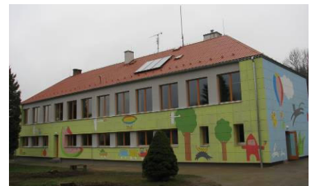
Zateplená MŠ Pitín