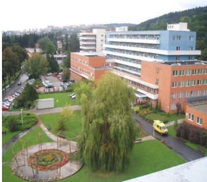
Krajská nemocnice Tomáše Bati ve Zlíně