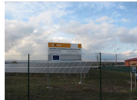
Fotovoltaická elektrárna v Ostrožské Lhotě

Fotovoltaická elektrárna v Ostrožské Lhotě (instalovaný výkon 2,25 MWp) se stala vítězem tří kategorií v 6. ročníku Solární ligy , kterou pořádá Liga Ekologických Alternativ (LEA). Cílem Solární ligy je osvěta a propagace využívání sluneční energie k výrobě elektřiny a tepla. V této soutěži soupeří obce a města o prestižní pořadí v jednotlivých kategoriích. V kategorii Sídla s termickými systémy zvítězila již tradičně obec Rusava díky velkoplošnému (540m 2 ) systému na ohřev vody místním koupališti.