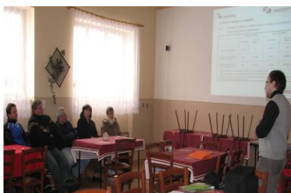
Seminář pro občany o programu Zelená úsporám

Díky změnám podmínek a zavedení podpory na zpracování projektu a energetického posouzení budovy (podpora platí v nezměněné výši i po 31.3.2010) se program Zelená úsporám rozjel úctyhodným tempem: první miliarda investiční podpory byla zaregistrována 11. února a hranice dvou miliard byla překročena koncem března. Výši přidělené podpory se Zlínský kraj ( 170 mil. Kč ) zařadil na čtvrté místo ze všech krajů, stejně jako počtem zaregistrovaných žádostí ( 1087 z celkem 11 150). Ve Zlínském kraji bylo zaregistrováno 609 žádostí (138 mil. Kč) na zateplování, dvě žádosti na podporu pasivní výstavby (0,5 mil. Kč) a 476 žádostí (31,5 mil. Kč) na instalaci kotlů na biomasu, tepelných čerpadel nebo solárních systémů pro přípravu teplé vody popř. přitápění.