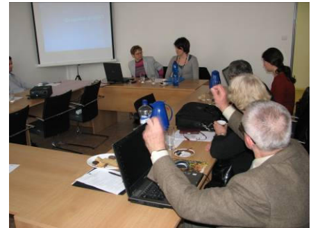
Úvodní setkání projektu Inovační platforma udržitelného rozvoje

Na konci března pořádala EAZK úvodní setkání partnerů projektu Inovační platforma udržitelného rozvoje (krátce Green4v4 ). Tento projekt je podpořen prostředky Vyšehradského fondu a má za cíl shromažďovat a šířit informace o projektech, inovacích a technologiích podporujících udržitelný rozvoj (obnovitelné zdroje energie, úsporná doprava,...). Partneri projektu z České republiky, Slovenska, Polska a Maďarska budou aktualizovat internetové stránky projektu vkládáním nových příspěvků a překladem článků partnerských organizací do národních jazyků.