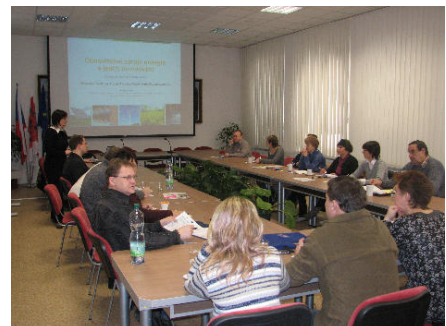
Seminář Obnovitelné zdroje energie a jejich povolování

Během prvních tří měsíců tohoto roku uspořádala EAZK ve spolupráci s Ministerstvem životního prostředí České republiky celkem 7 seminářů Obnovitelné zdroje energie (OZE) a jejich povolování v několika městech ve Zlínském kraji. Cílem těchto seminářů, kterých se účastnilo již více než 100 zástupců veřejné správy, je interaktivní formou seznámit zájemce s jednotlivými OZE, jejich potenciálem a procesy povolování. Velkým přínosem seminářů je také zpětná vazba od jednotlivých účastníků, kteří mají zkušenosti s konkrétními projekty v jejich regionu.