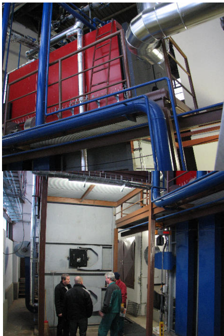
Nový kotel na biomasu v Brumově-Bylnici

Energetická agentura Zlínského kraje, o.p.s. byla jedním z pořadatelů semináře Energetický management měst a obcí , který se konal 25.2.2010 v sídle Zlínského kraje. Cílem semináře bylo poskytnout účastníkům z řad zástupců komunální sféry informace o efektivním energetickém managementu , opatřeních vedoucích k dosažení energetických úspor a možnostech financování těchto opatření (dotace z Operačního programu Životní prostředí, metoda EPC – Energy performance contracting). Na semináři byla také prezentována energetická politika Zlínského kraje stejně jako praktické zkušenosti s provozováním tepelných čerpadel, obecní kotelny na biomasu (Brumov-Bylnice) a moderního systému veřejného osvětlení. Informace poskytnuté na tomto semináři jsou užitečné pro dosažení nejenom energetických, ale především finančních úspor při správě obecního majetku.