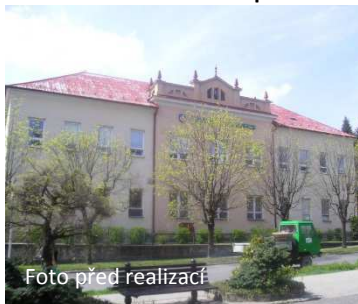
Foto před realizací

Nemocnice Slavičín – úspora 50% – nemocnice byla komplexně zateplena a dále byly instalovány solární trubkové