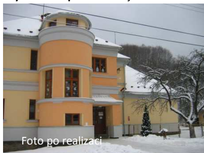
Foto po realizaci

na provoz činily průměrně 68 tis. Kč . Skutečné náklady na komplexní zateplení a výměnu výplní otvorů činily 2,26 mil. Kč , z toho výše dotace 1,65 mil. Kč . Výsledkem tohoto kroku je roční úspora na provoz školky přibližně 38 tis. Kč s návratností investice 16 let . Součástí opatření byla také rekonstrukce kotelny, kde