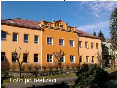
Foto po realizaci

kolektory pro ohřev teplé užitkové vody o výkonu 32,5kW a v celkové účinné ploše cca. 48,5m 2 . Sklon je 40° a orientace jižní. Podíl solární soustavy na ohřevu TV je 45%. Což významně ovlivňuje ekonomickou návratnost zařízení, kdy při době životnosti minimálně 20 let je návratnost 7,7 let . Nemocnice tak