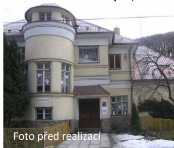
Foto před realizací

Mateřská škola Sv. Štěpán, Brumov - Bylnice – úspora 56% – jedná se o školku o dvou třídách, ve které roční náklady