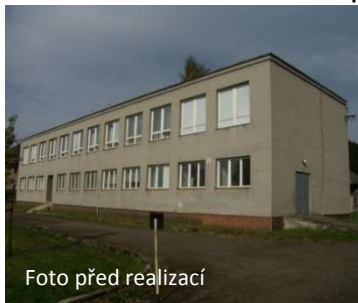
Foto před realizací

Mateřská škola Dolní Bečva – úspora 63% – školka si prošla komplexním zateplením obvodového pláště, včetně