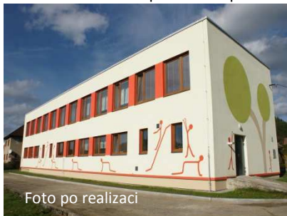
Foto po realizaci

střechy a výměny výplní otvorů. Stávající dřevěná okna a dveře byla vyměněna za nová okna a dveře s izolačními trojskly. Obvodové zdi zatepleny šedým polystyrenem tloušťky 140mm a střecha bílým polystyrenem tloušťky 260mm. Dosažená úspora nákladů na vytápění činí 90 tisíc Kč za rok . Prostředky na