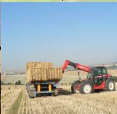
Obr. č.2 – Sklizeň slámy