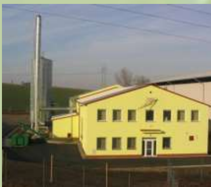
Obr. č.1 – BEC Roštín