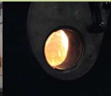
Obr. č.5 – Spalování slámy