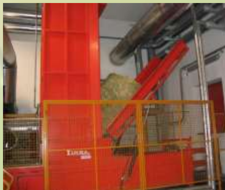
Obr. č.4 – Dávkování slámy