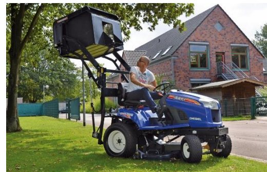
Profesionální technika obchod, servis