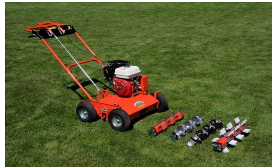
Technické oddělení výroba, instalace