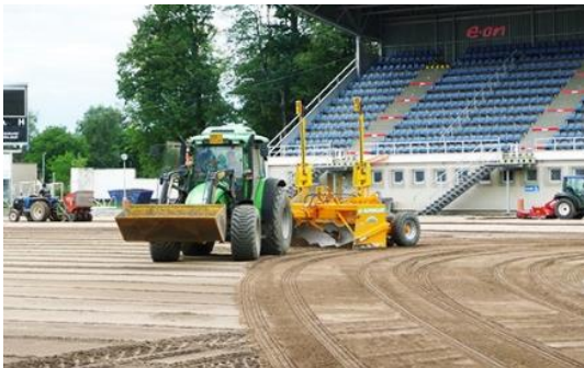
Sportovní trávníky poradentství, služby, realizace