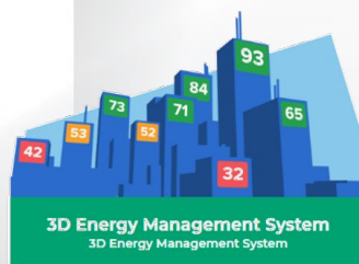
3D Energy Management System 3D Energy Management System