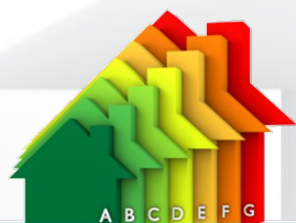
Energy Efficient Cities Energy Efficient Cities

Databáze zahrnující elektrické a elektronické přístroje. Spojuje zákazníky zájímající se o energeticky efektivní projekty s kvalifikovanými poskytovateli služeb a energetickými experty