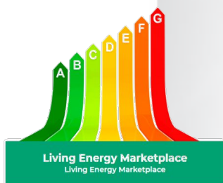
Living Energy Marketplace Living Energy Marketplace