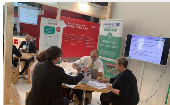
Čtvrté italské setkání tematické skupiny BOOSTEE-CE v Rimini

Region Emilia-Romagna zorganizoval své čtvrté setkání tematické skupiny v rámci mezinárodního veletrhu Ecomondo v Rimini. Účastníci měli možnost diskutovat ze zástupci regionu Emilia - Romagna a toto setkání bylo zaměřeno na rekapitulaci výsledků projektu BOOSTEE-CE, jeho cíle a aktivity se speciálním důrazem na platformu OnePlace , která svým uživatelům umožňuje sdílet zkušenosti, identifikovat příklady dobré praxe a navrhnout řešení v oblasti energetické efektivity.