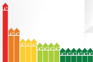
Financing Energy Efficiency Financing Energy Efficiency