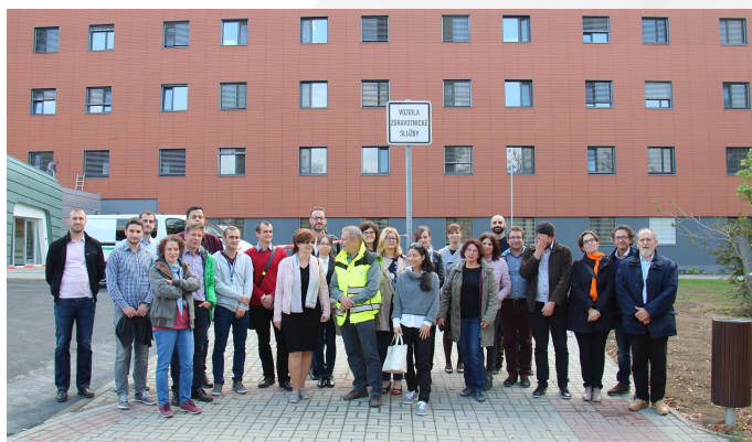
Projektový tým BOOSTEE-CE na návštěvě v Uherskohradištské nemocnici

Čtvrté projektové setkání projektu BOOSTEE-CE proběhlo ve Zlíně ve dnech 18. - 19. října 2018. Předmětem setkání bylo revidovat a zhodnotit dosavadní průběh projektových aktivit, otestovat 3D systém energetického managementu v rámci platformy OnePlace a naplánovat následné aktivity projektu. Součástí setkání byla také návštěva Uherskohradištské nemocnice, jejíž 3 budovy jsou zahrnuty do pilotních aktivit projektu BOOSTEE-CE.