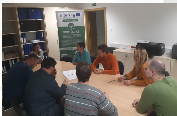
Druhé slovinské setkání tematické skupiny BOOSTEE-CE ve Velenje

Město Velenje and E-Institute organizovali druhé setkání tematické skupiny projektu BOOSTEE-CE ve Slovinsku, ve Velenje ve dnech 10. a 29. října 2018 . Setkání bylo rozděleno do dvou částí (setkání s místními podnikateli a regionální energetickou agenturou). Účastníci byli informováni o pokroku projektu BOOSTEE-CE a místní pilotní akci – instalace smart meteringu v Hudební škole Fran Korun Koželjski ve Velenje . Diskutovány byly zejména dosavadní výsledky provedené investice, ale také využití platformy OnePlace.